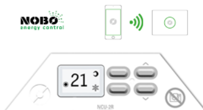
NOBØ NCU 2R

A manuális kar segítségével könnyen beállítható a szoba hőmérséklete. A NOBØ Energy Control és NOBØ ECO HUB vezérlővel ajánlott a használata, de központi vezérlő nélkül is használható.