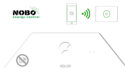
NOBØ NCU ER

Digitális megjelenítés, komfort és takarékos hőfok beállítási lehetőség. A kijelző háttér megvilágítással készül, mely kis idő után lehalványul, hogy ne zavarja az éjszaka nyugalmát. A NOBØ Energy Control és NOBØ ECO HUB vezérlővel ajánlott a használata, de központi vezérlő nélkül is használható.